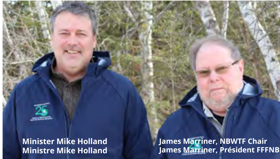
Minister Mike Holland Ministre Mike Holland